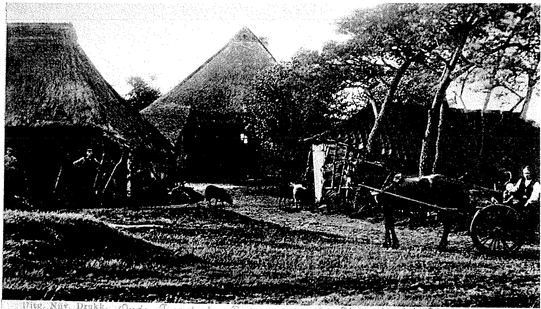
Uitz. Nijv. Drukk. Oude Iwentsche Boerenwoning in Noetsese, bij Nijverdal.