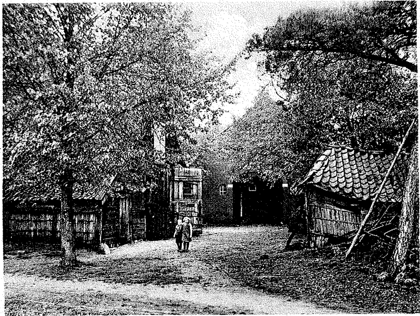
Boerderij in Noetsese Nijverdal.