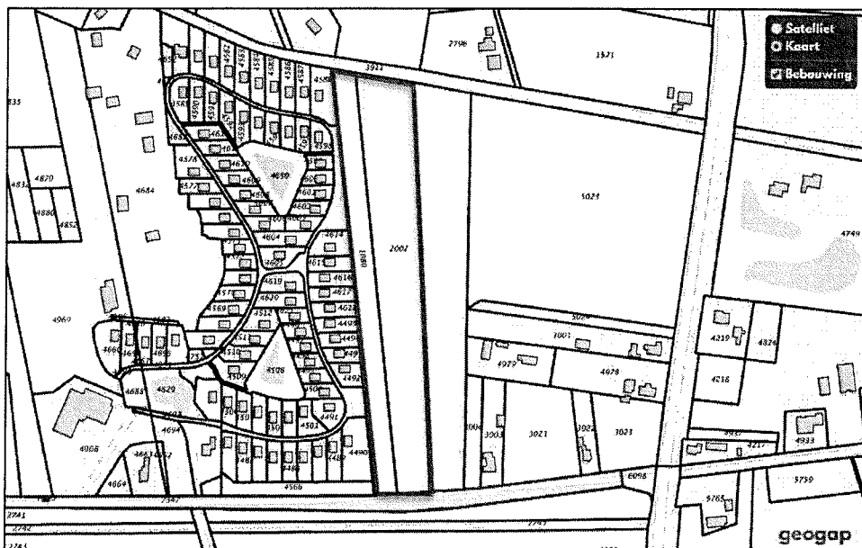
Figuur 1: Globale aanduiding percelen in eigendom bij cliënt

Het bestemmingsplan ziet op de mogelijke realisatie van vijf verblijfsaccommodaties op twee percelen aan de Ommerweg, kadastraal bekend als gemeente Hellendoorn, Sectie I, Nummer 2003 en 5023. Cliënt is eigenaar van twee aangrenzende percelen, kadastraal bekend als gemeente Hellendoorn, Sectie I, nummer 1080 en 2002 (zie Figuur 1).