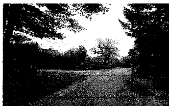
Foto; volledige verkeersafwikkeling vanaf verharde zandweg linksaf naar N347

Mogen wij uit paragraaf 3.3.1 "Verkeer" opmaken dat het verkeer met als bestemming de manege c.q. het manegeterrein, zowel ingaand als uitgaand, uitsluitend via de nog te verharde zandweg (Pastoor Rientjesstraat) van en naar de N347 (Ninaberlaan) wordt geleid?