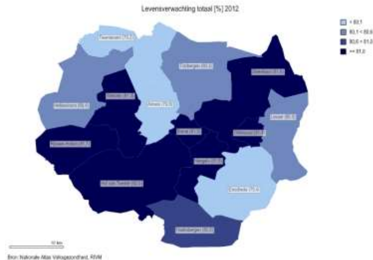
Figuur 2: Gemiddelde levensverwachting bij geboorte (in jaren) per gemeente in Twente, 2009 – 2012